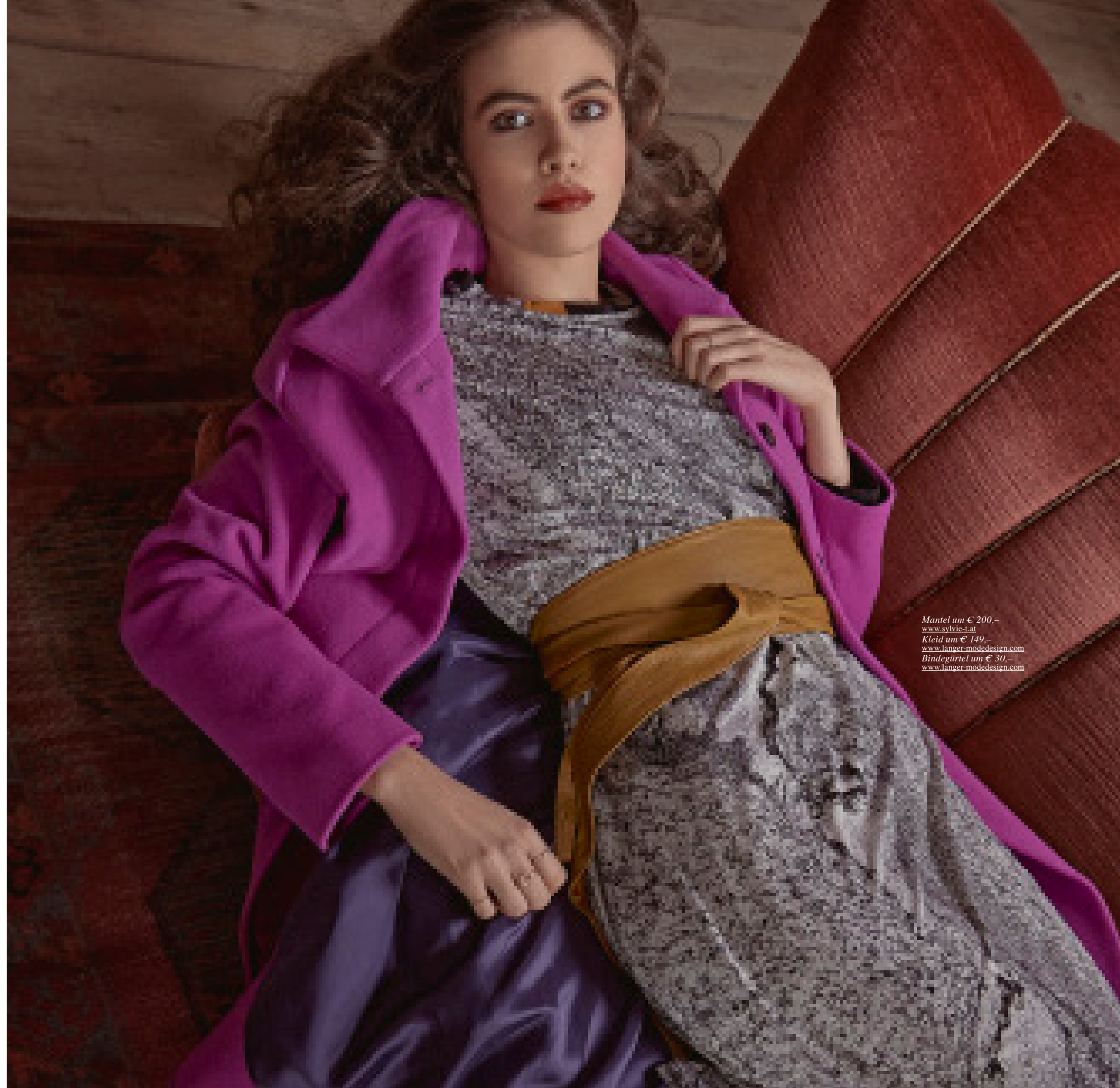
Mantel um € 200,- www.sylvie-t.at Kleid um € 149,- www.langer-modedesign.com Bindegürtel um € 30,- www.langer-modedesign.com