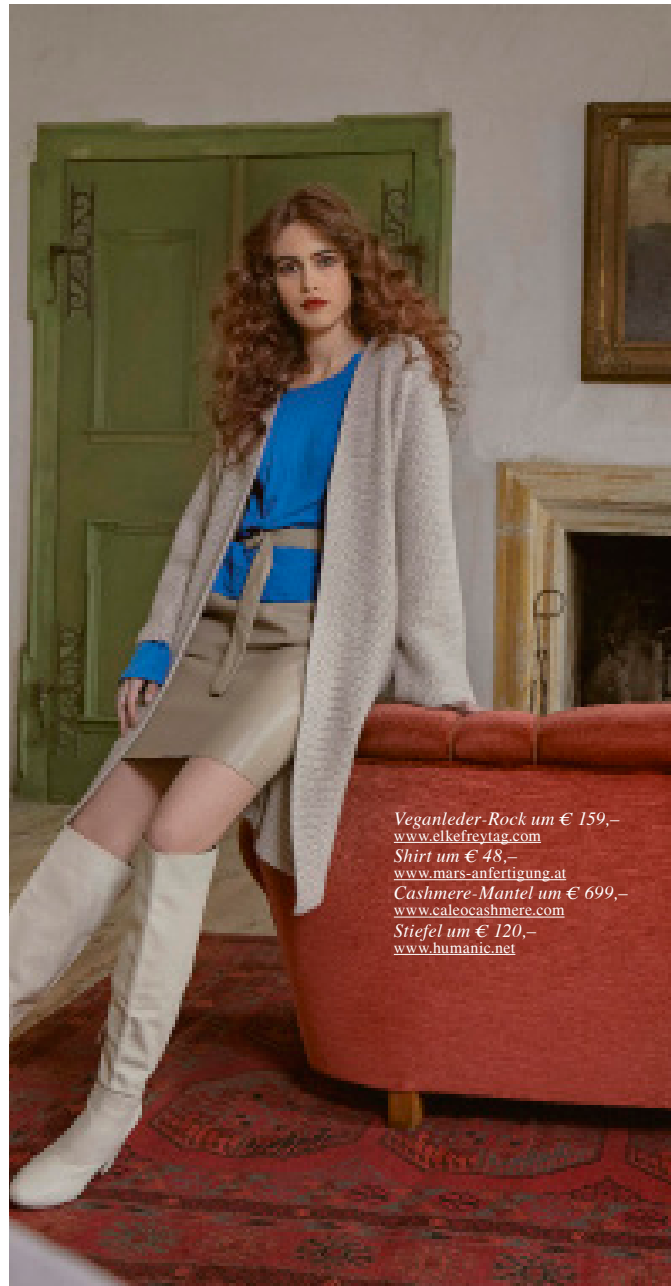
Veganleder-Rock um € 159,- www.elkefreytag.com Shirt um € 48,- www.mars-anfertigung.at Cashmere-Mantel um € 699,- www.caleocashmere.com Stiefel um € 120,- www.humanic.net