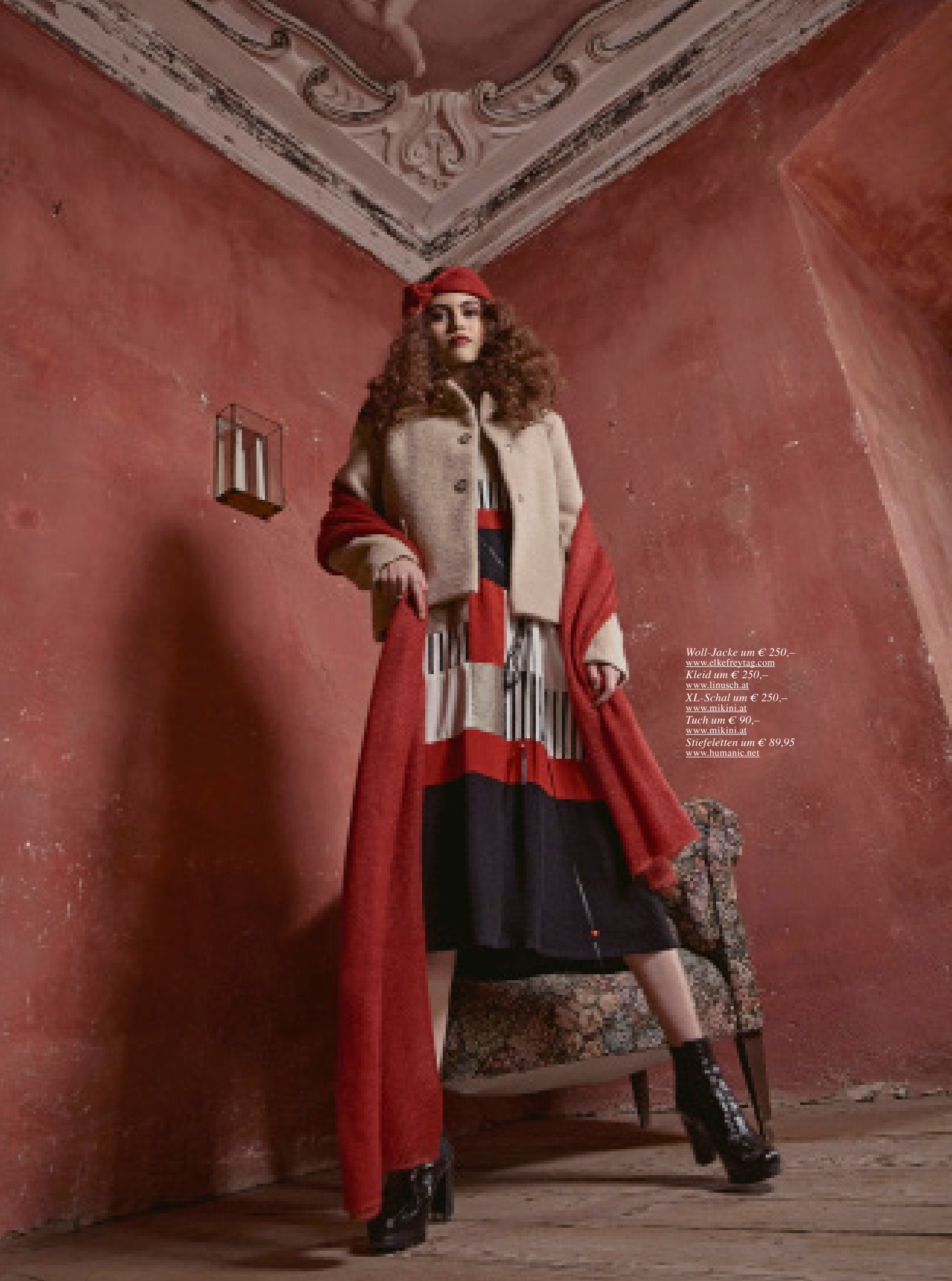
Woll-Jacke um € 250,- www.elkefreytag.com Kleid um € 250,- www.linusch.at XL-Schal um € 250,- www.mikini.at Tuch um € 90,- www.mikini.at Stiefeletten um € 89,95 www.humanic.net