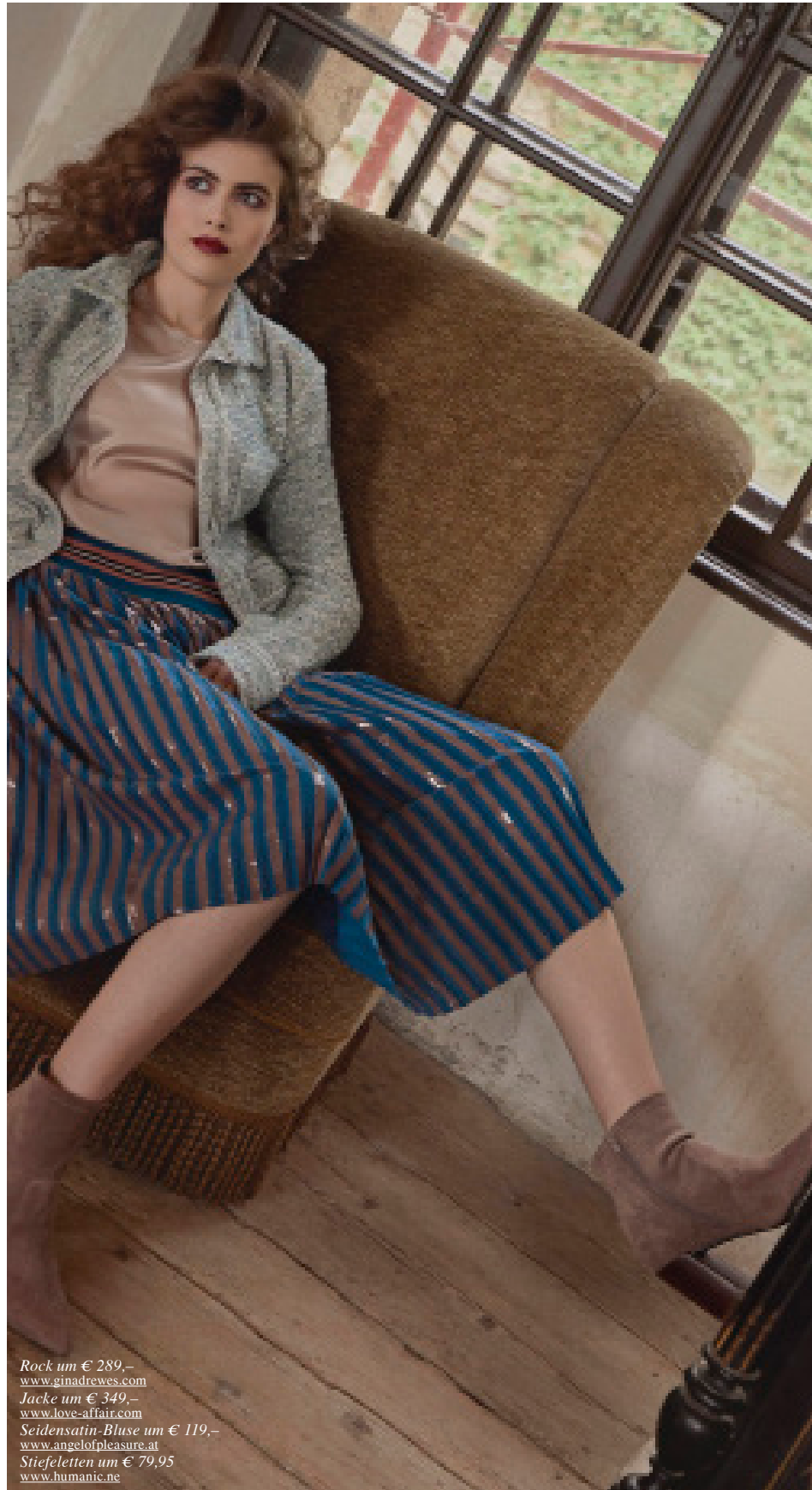
Rock um € 289,- www.ginadrewes.com Jacke um € 349,- www.love-affair.com Seidensatin-Bluse um € 119,- www.angelofpleasure.at Stiefeletten um € 79,95 www.humanic.ne